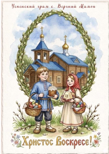
Успенский храм с. Верхний Мамон

Заповеди Христовы есть выражение Его любви ко мне. И я хочу выразить свою любовь к Нему исполнением Его заповедей. Я с радостью это делаю! Мне это не трудно. Любовь – она и учит, и сподвигает. Любовь не есть некая перспектива, которую я достигну когда-нибудь, любовь должна пребывать во Мне всегда. Когда во мне нет любви – это катастрофа. Тогда и начинается формальное христианство. Это беда. Когда кончается любовь, начинается нелюбовь. Вот это страшно.